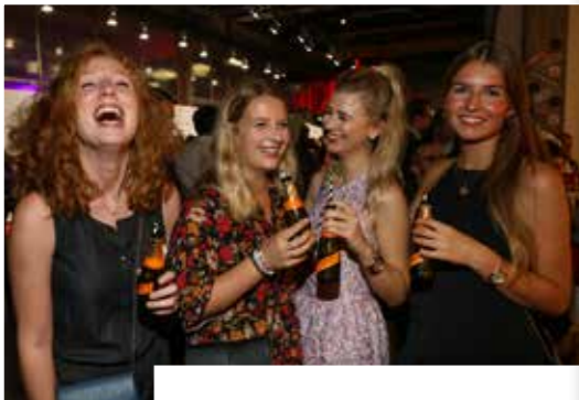
GUTE LAUNE GARANTIERT die Gäste genossen prickelnden Mionetto Prosecco