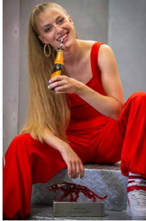
FREUT SICH über ihren Panther: Preisträgerin Kidjo Kat hat Grund zum Anstoßen